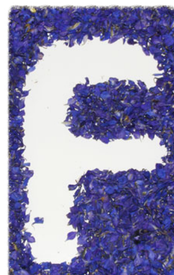
Jest nas ponad 1000 !!!