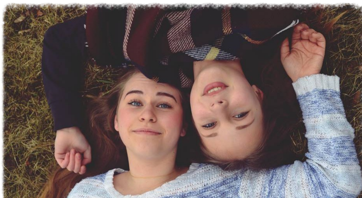
II miejsce w Junior Media