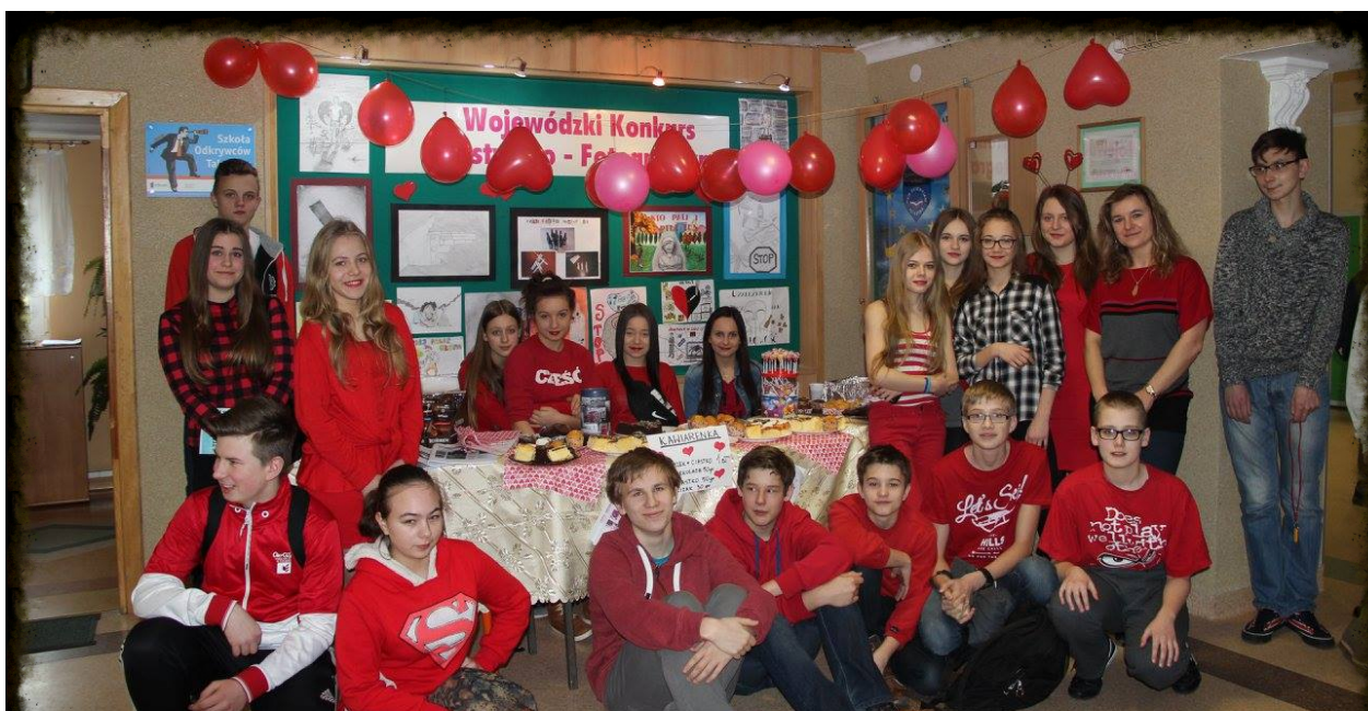
Walentynki w naszym gimnazjum

WALENTYNKI w GIMNAZJUM NR 4 były okazją do dobrej zabawy oraz pomocy bezdomnym psikom. 12 lutego obchodziliśmy dzień zakochanych. Gazetka „Ogryzek” oraz SU przygotowali dla wszystkich