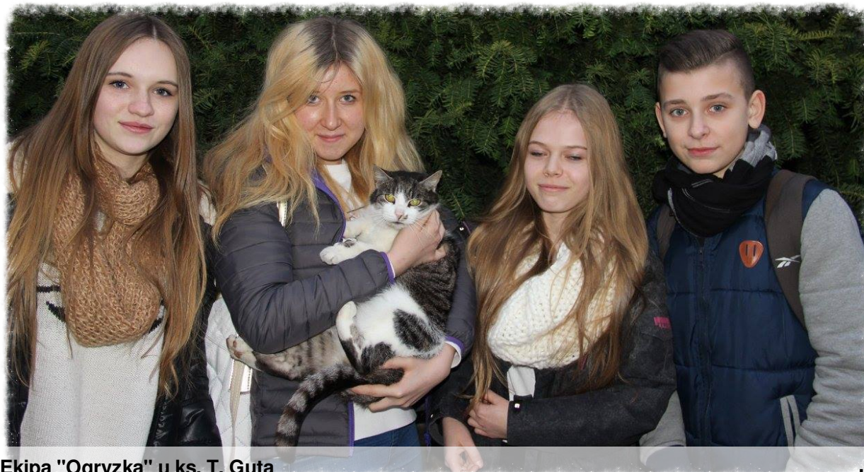
Ekipa "Ogryzka" u ks. T. Guta