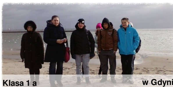
Klasa 1 a