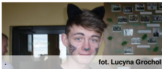
fot. Lucyna Grochol