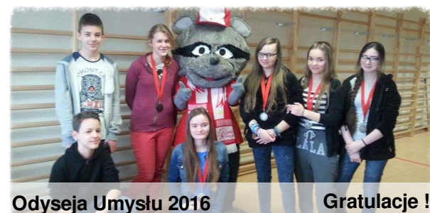
Odyseja Umysłu 2016