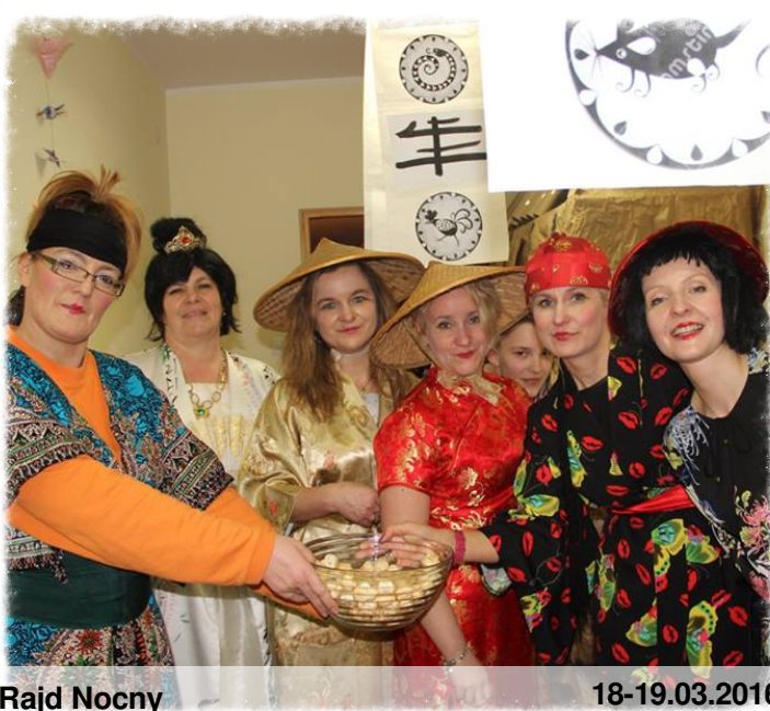
Rajd Nocny 18-19.03.2016