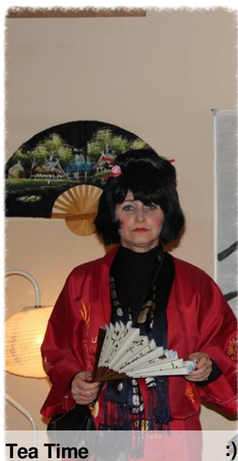
Tea Time :)