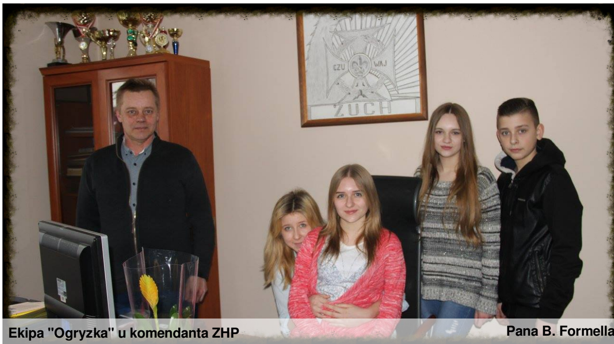
Ekipa "Ogryzka" u komendanta ZHP