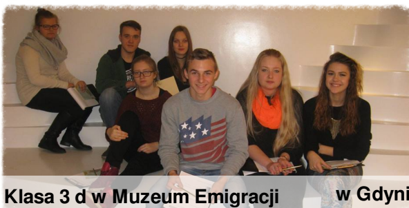
Klasa 3 d w Muzeum Emigracji