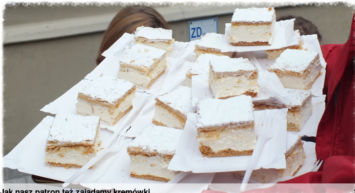
Jak nasz patron też zajadamy kremówki

Od Jana Pawła II mogę nauczyć się radości z każdej rzeczy, nawet z tej, która nie podoba mi się, pokory do wszystkiego i dla wszystkich,