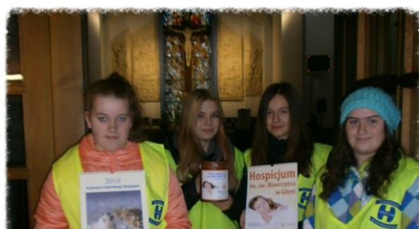
Jak Karol Wojtyła pomagamy potrzebującym