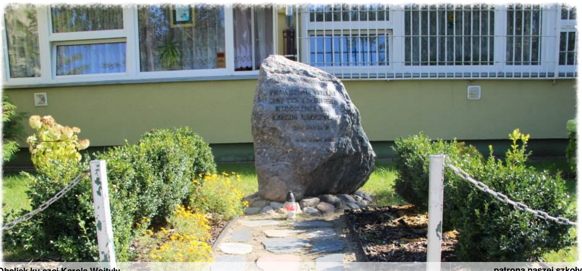
Obelisk ku czci Karola Wojtyły