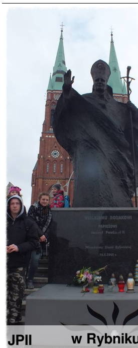
JPII w Rybniku

Od Karola Wojtyły można nauczyć się rzeczy nie tylko duchowych. Był on człowiekiem wszechstronnie uzdolnionym- jeździł na nartach, był aktorem, pisał wiersze, chodził po górach... możemy nauczyć się od Niego aktywności fizycznej K7