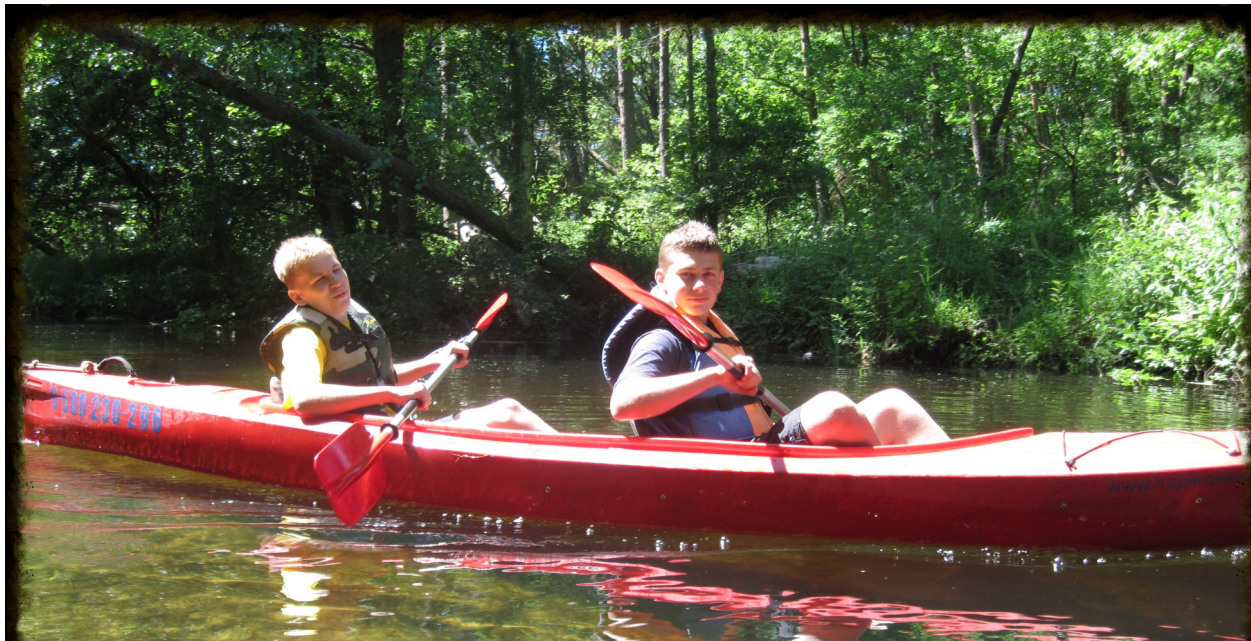
Wzorem naszego patrona