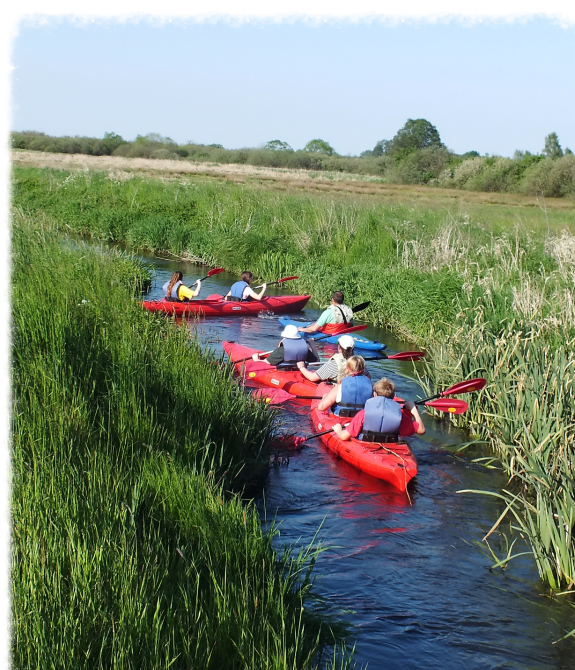
Kochamy naturę i sport