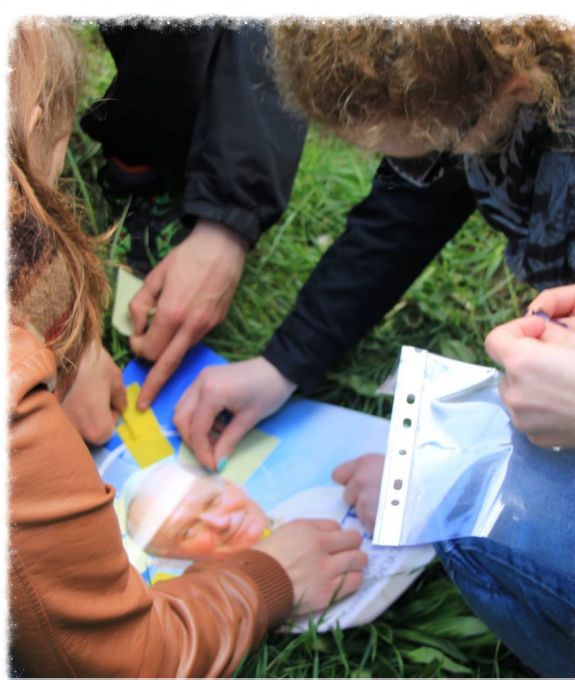
Rajd turystyczny na cześć naszego patrona