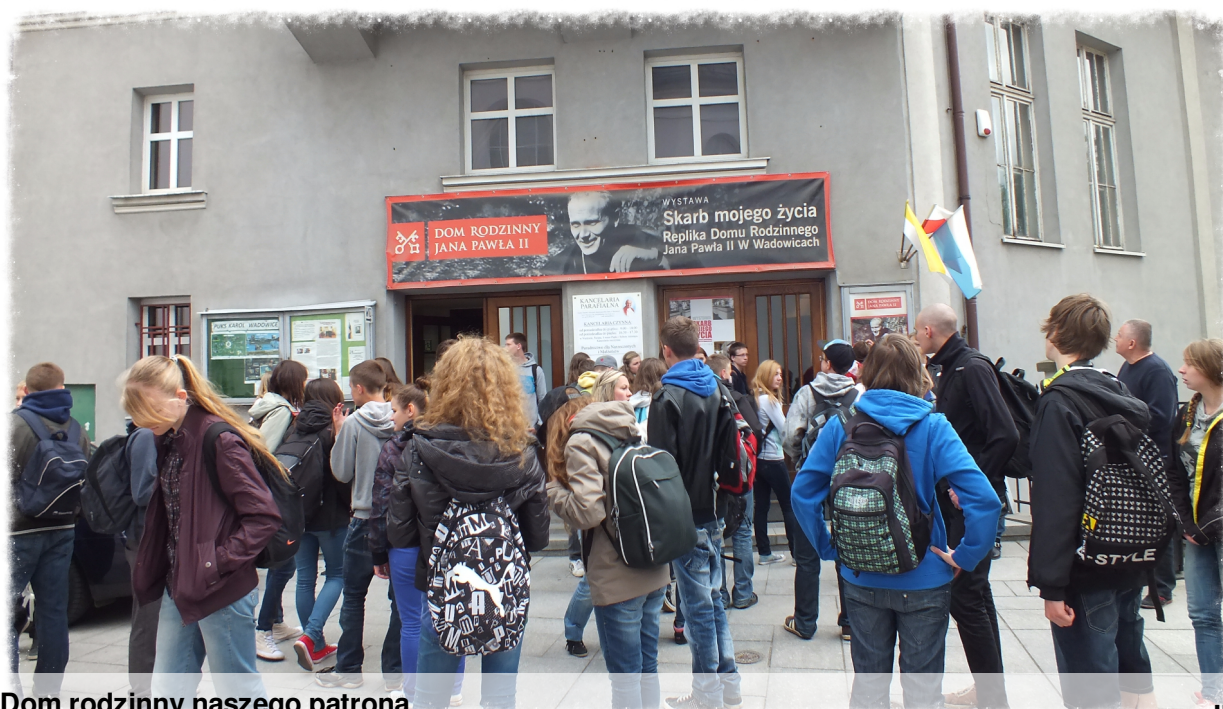
Dom rodzinny naszego patrona