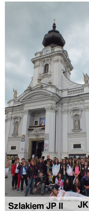
Szlakiem JP II JK