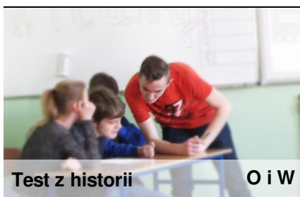
Test z historii

Historia dobrze już znana - to test wiedzy historycznej z zakresu szkoły podstawowej. Gimnazjaliści przygotowali także prezentację na temat Żołnierzy Wyklętych i Inki.