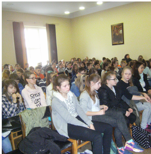
W progach gimnazjum