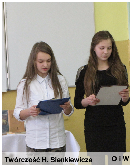
Twórczość H. Sienkiewicza