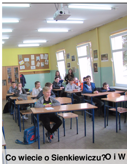
Co wiecie o Sienkiewiczu? O i W