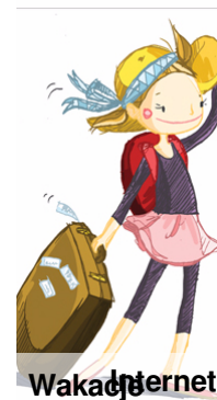
Wakacje i Internet

Wkrótce długo oczekiwane wakacje. Pamiętajcie, aby wypoczywać przyjemnie, wesóło, ale przede wszystkim bezpiecznie!