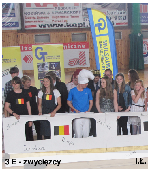
3 E - zwycięzcy