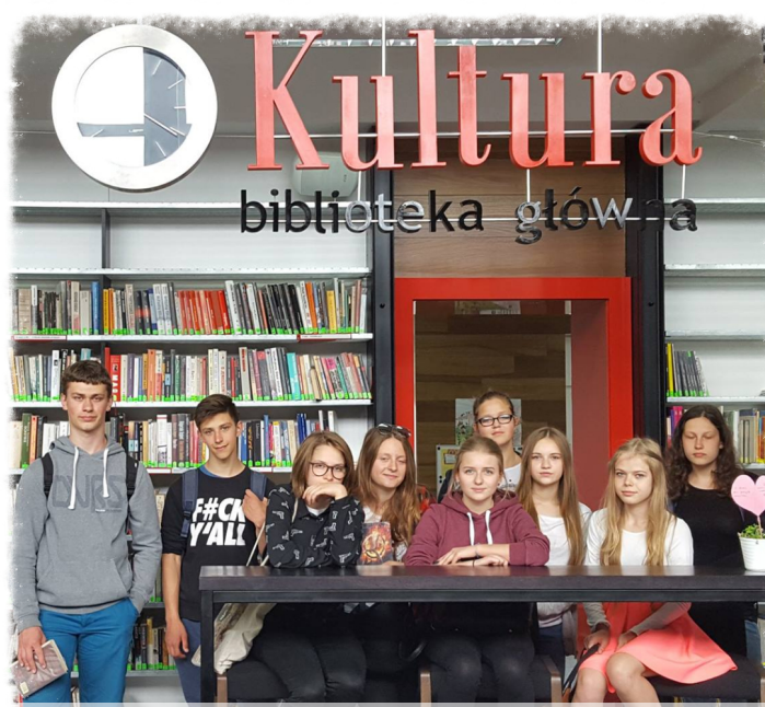
Stacja Kultura -> Akcja "Jak nie czytamy jak czytamy"