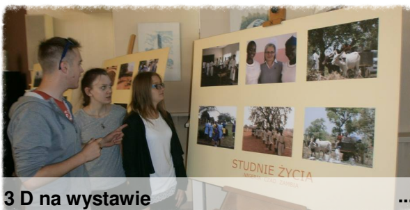
3 D na wystawie