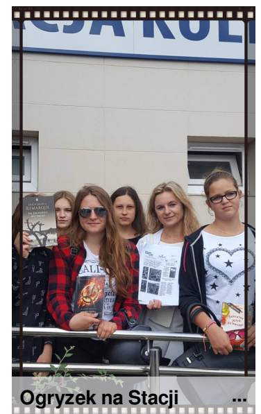
Ogryzek na Stacji ...

Nasze gimnazjum również brało w niej udział :)