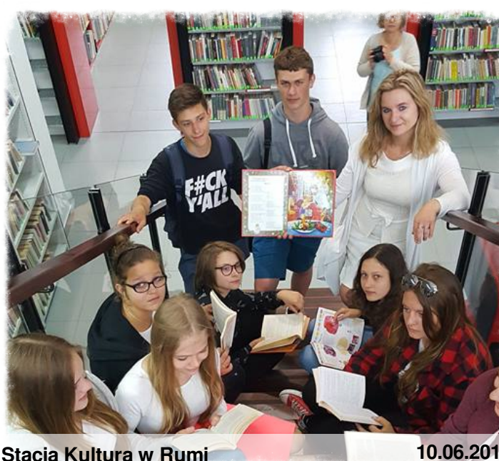
Stacja Kultura w Rumi 10.06.2016