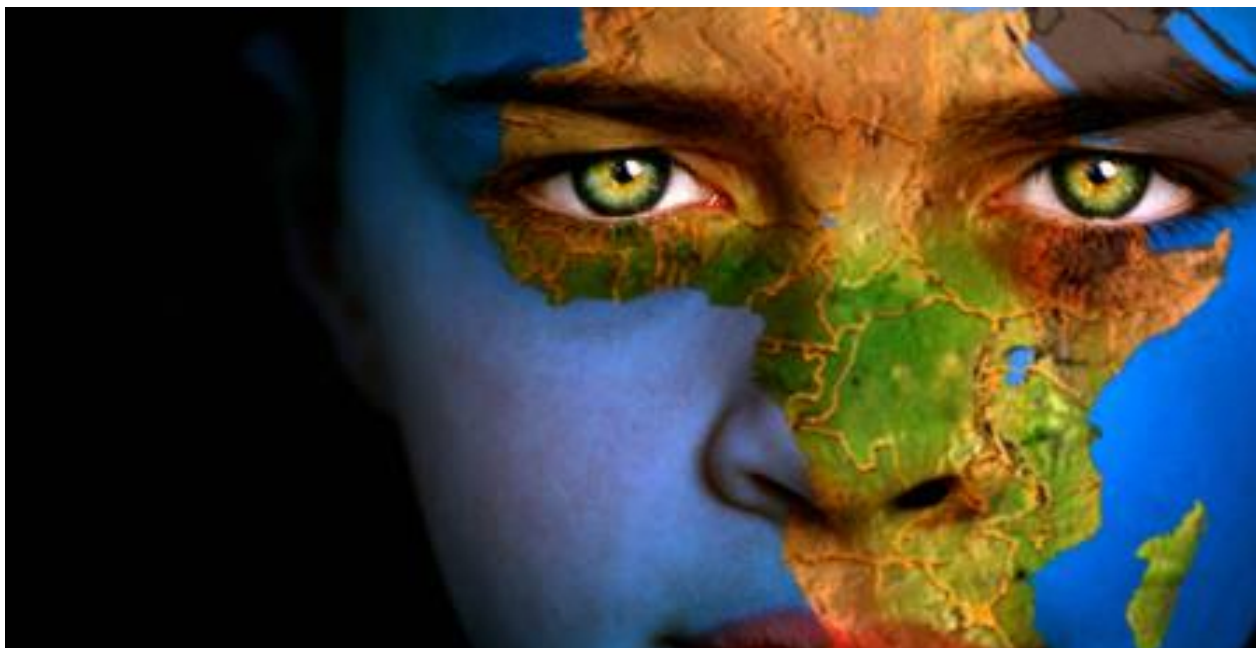
Krzyżyki dla Afryki