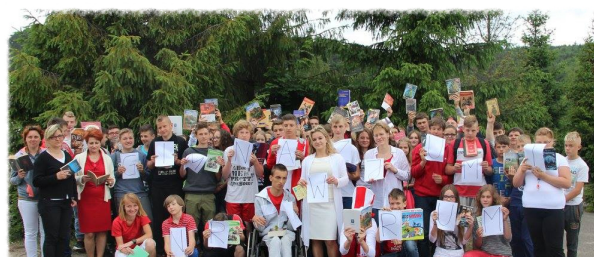
Miłośnicy akcji "Bijemy rekord w czytaniu"