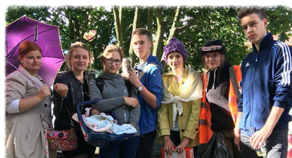
Nasi szkolni aktorzy na festynie