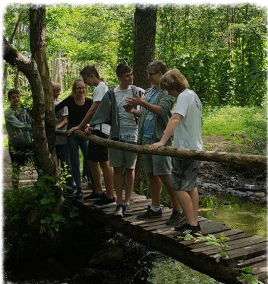
Trójmiejski Park Krajobrazowy