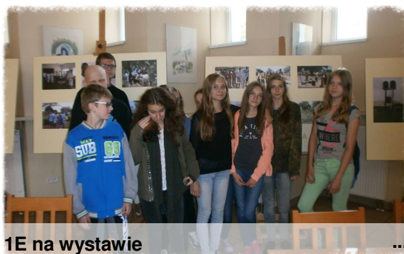
1E na wystawie