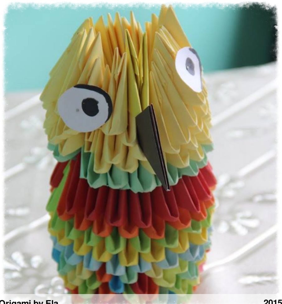
Origami by Ela