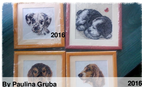
By Paulina Gruba