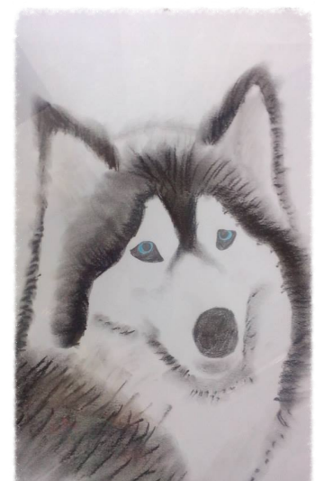
Paulina Gruba 3e

Fotografie widniejące na tej stronie przedstawiają talent artystyczny dziewczynek uczęszczających do klasy artystycznej :)