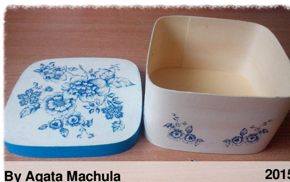
By Agata Machula