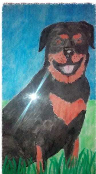
Paulina Gruba 3e