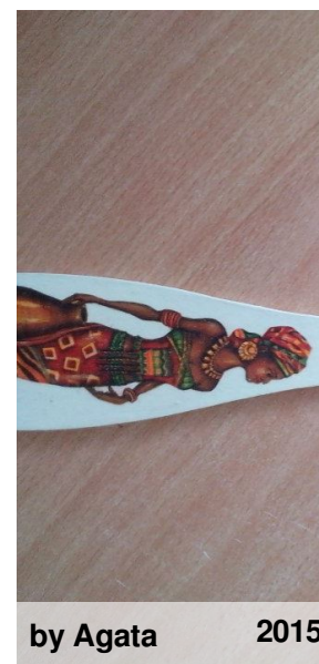
by Agata 2015

m.in. metodą decoupage, malując, rysując, wykonując ozdoby świąteczne, bombki, itp. Gratulujemy !