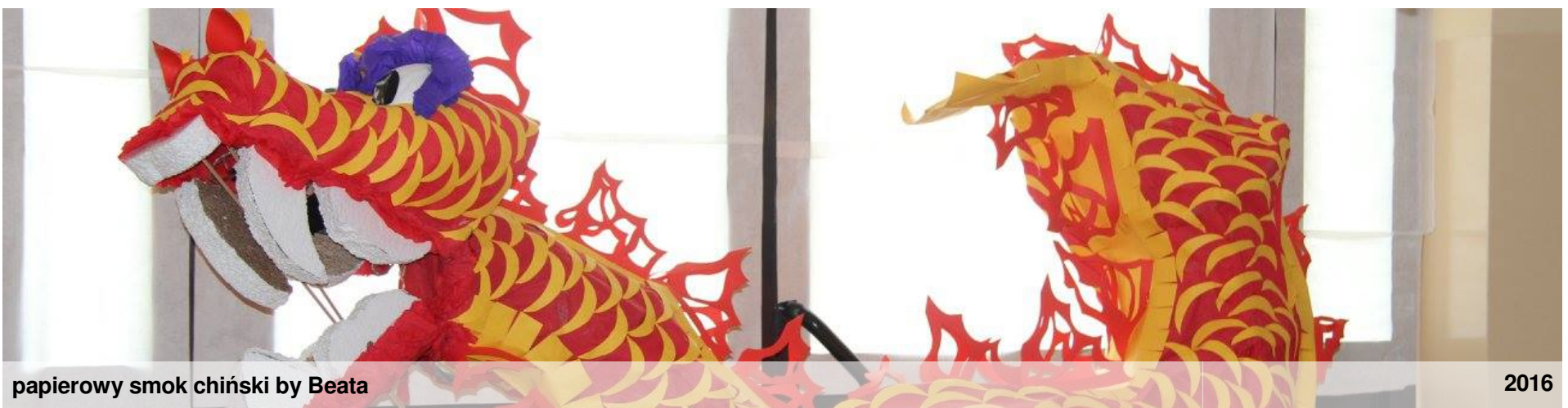
papierowy smok chiński by Beata