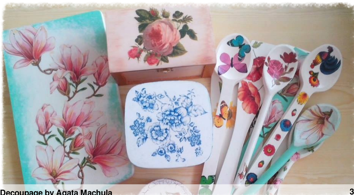
Decoupage by Agata Machula