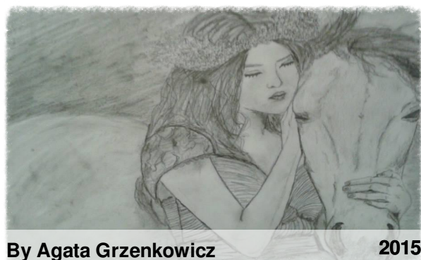
By Agata Grzenkowicz