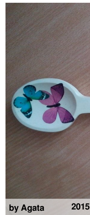
by Agata 2015