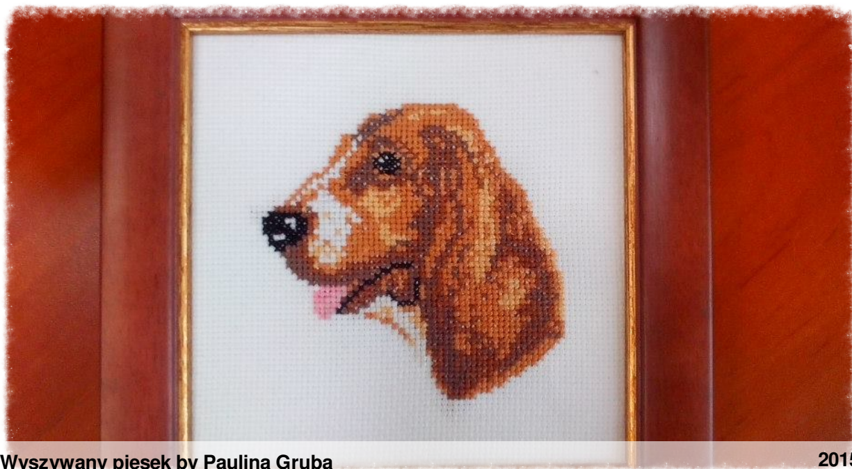
Wyszywany piesek by Paulina Gruba