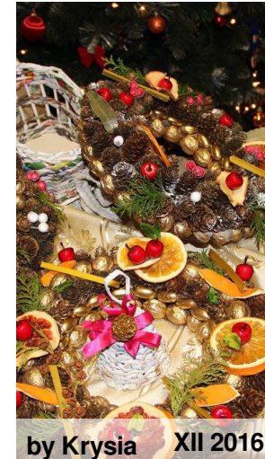
by Krysia XII 2016