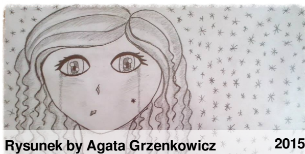
Rysunek by Agata Grzenkowicz