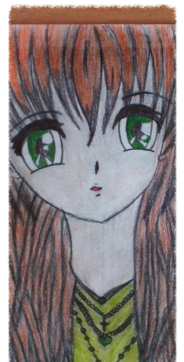
Paulina Gruba 3e