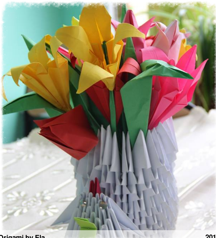
Origami by Ela