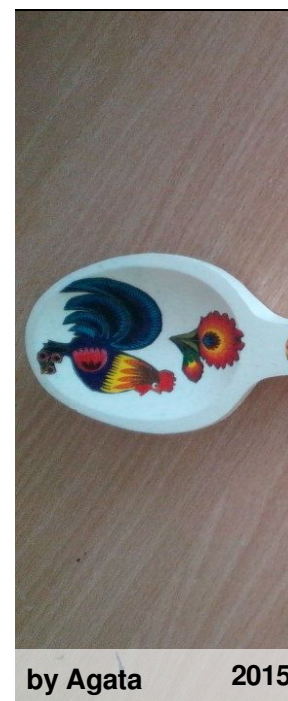
by Agata 2015