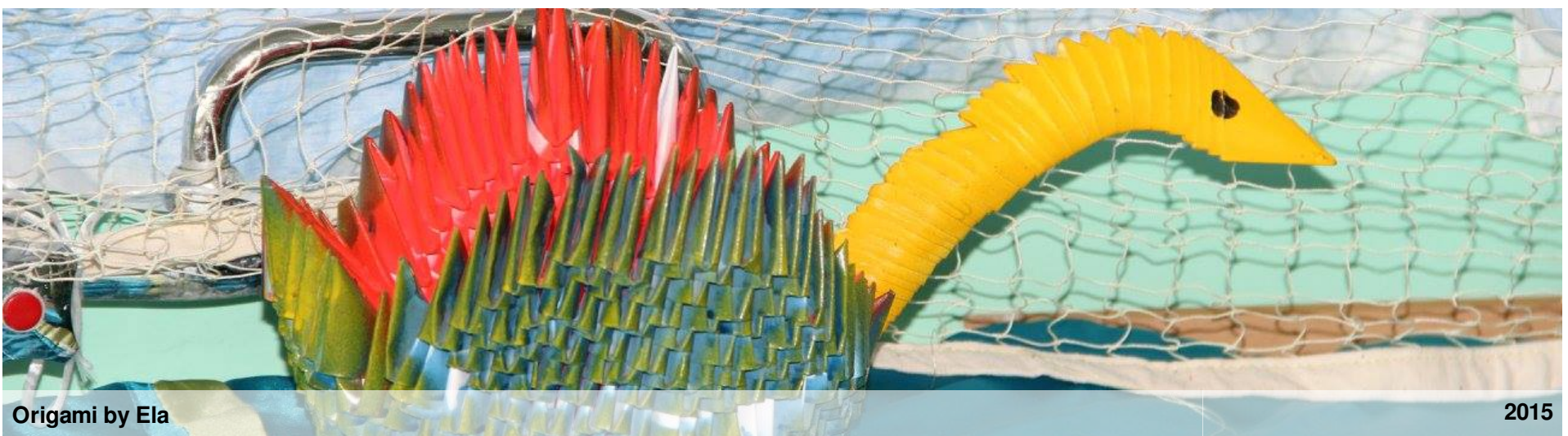
Origami by Ela