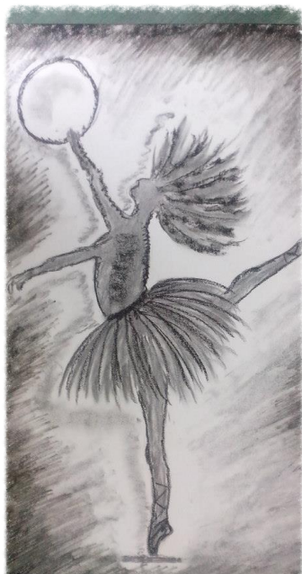
Agata Grzenkowicz 3e