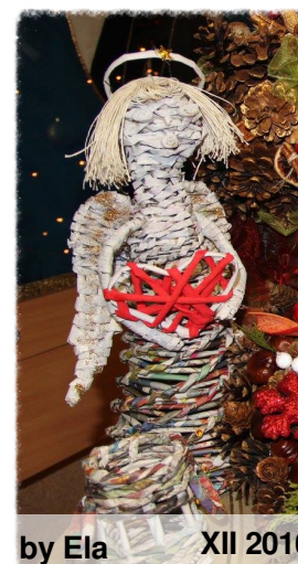
by Ela XII 2016