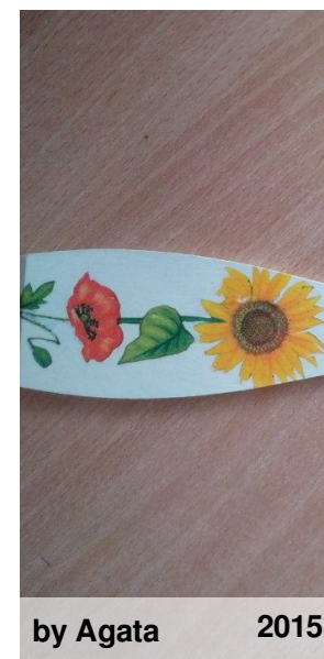
by Agata 2015