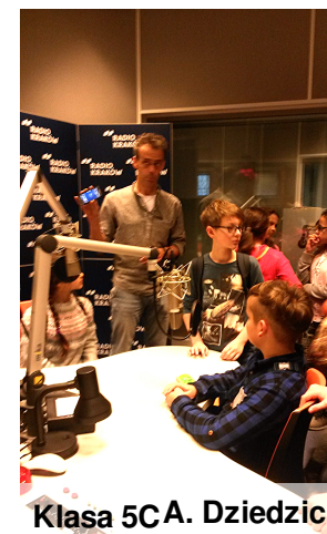
Klasa 5CA. Dziedzic

Co tydzień w Radiu Kraków organizowany jest plebiscyt na wyczyn i blamaż tygodnia. Na jego łamach przedstawiane są najważniejsze, najbardziej chwalebne i te najbardziej zawstydzające wydarzenia w Krakowie. Głosować mogą wszyscy na stronie www.radiokrakow.pl . Natomiast wysłuchać propozycji i komentarzy można w sobotę od godziny 11:00 do 12:00. Do studia zapraszani są małopolscy politycy i eksperci w danych dziedzinach (np. smogu). Rozstrzygnięcie w każdy poniedziałek o godzinie 8:10.