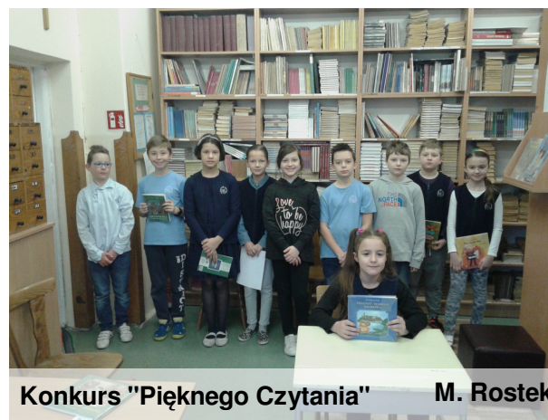
Konkurs "Pięknego Czytania"