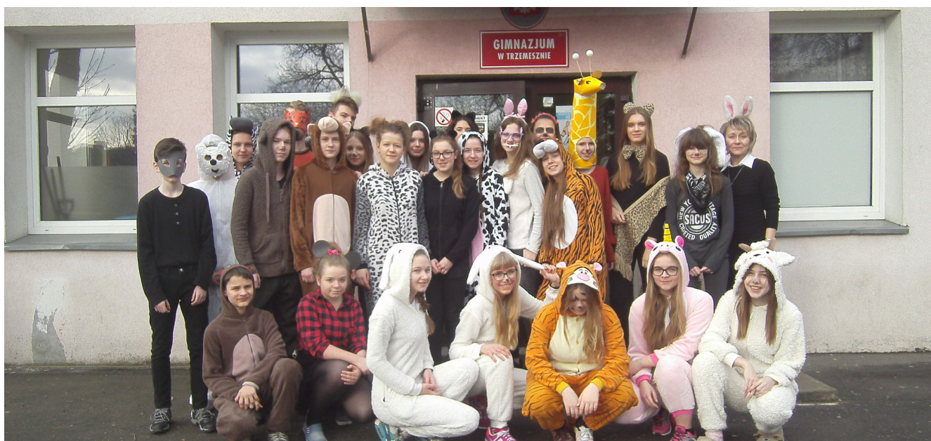
Klasowe ZOO 2 D