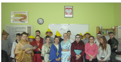
Kraj Kwitnącej Wiśni 2 O. K.