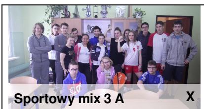
Sportowy mix 3 A