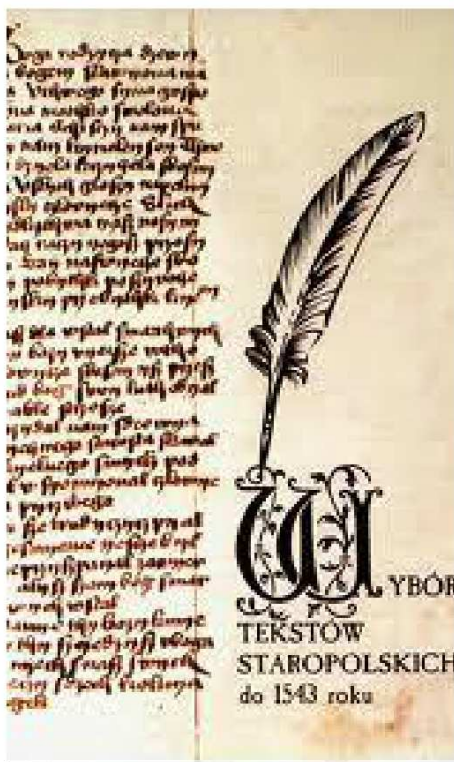
fragment "buli gnieźnieńskiej" ( www.google.pl )

Nie zastępuje on narodowych języków i nigdy nie stał się językiem urzędowym.