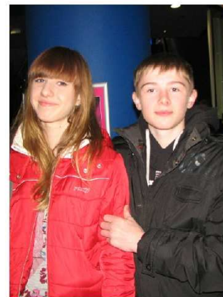
Franois de La Rochefoucauld x x x

autentycznej historii, przez co dobrane sceny wydają się bardziej wiarygodne. Chociaż i tak przez ich smutny charakter, dalej pozostają zupełnie niewyobrażalne. Najnowszy film, Agnieszki Holland, to światowej klasy kino! Wyjątkowo przemyślany, pełen metafor, posiadający wiele zwrotów akcji, opowiedziany niezwykłym językiem film. Od, dziś zajmuje on na mojej prywatnej liście filmów Agnieszki Holland, pierwsze miejsce.