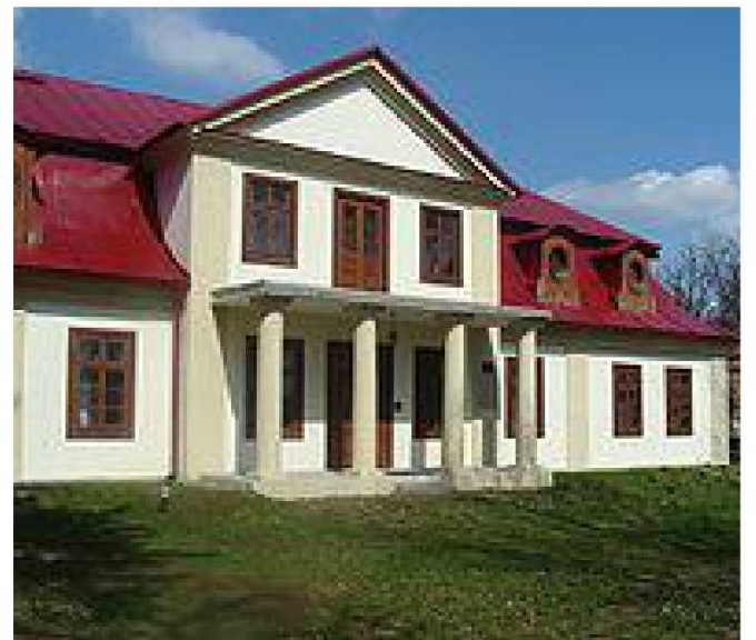
Miejsce urodzenie Bolesława Prusa. Teraz budynek został zamieniony na plebanię.