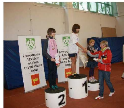
Fot. Rozdanie medali.