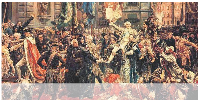
Jan Matejko "Konstytucja 3 Maja 1791 roku". Obraz znajduje się w zbiorach Zamku Królewskiego w Warszawie.

Odkąd chodzimy do szkoły, zawsze była akademia. Dziś tylko widzimy drzwi szkoły.