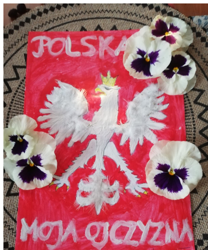
III miejsce Maja Woźniak