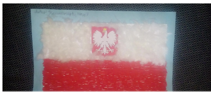
III miejsce Artur Kaczmarczyk