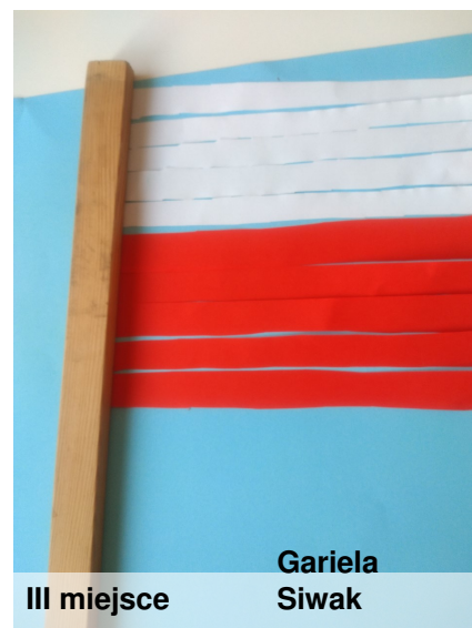
III miejsce Gariela Siwak