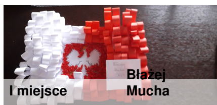
I miejsce Błażej Mucha