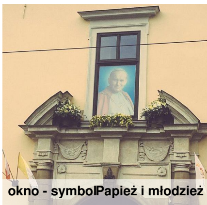
okno - symbol Papież i młodzież