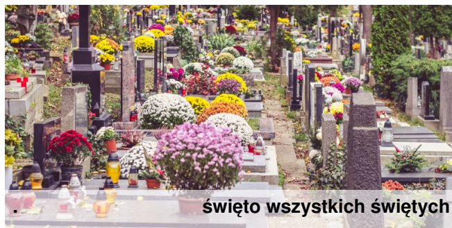
święto wszystkich świętych