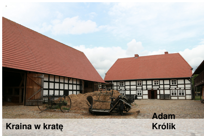
Kraina w kratę