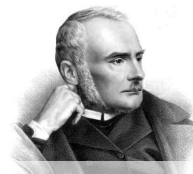
ZYGMUNT KRASIŃSKI autor Nie-Boskiej komedii

Temat dramatu to upadek powstania listopadowego.