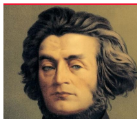
ADAM MICKIEWICZ wieszcz narodowy

W swoich utworach tworzył wzorce narodowych bohaterów, Wystarczy wspomnieć Grażynę , Śmierć pułkownika , Redutę Ordona . Pisał o obowiązkach Polaka patrioty, o czym czytamy choćby w Panu Tadeuszu .