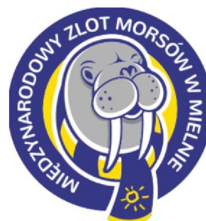
logo zlotu w Mielnie