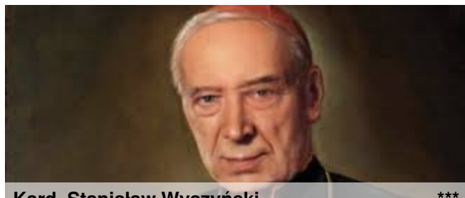
Kard. Stefan Wyszyński ***