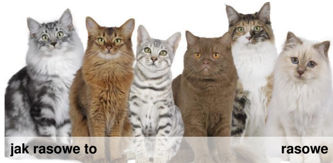
jak rasowe to

Czy wiecie, że koty zostały udomowione około 9500 lat temu. Gatunek ten prawdopodobnie pochodzi od kota nubijskiego. W Europie krzyżował się ze żbikiem. Koty żyjące na wolności dożywają średnio do 8 lat, natomiast koty trzymane w domu osiągają wiek do 20 lat, a niektóre więcej.