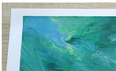
Red. Weronika Szczepańska