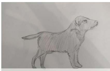
Powyżej przepiękna praca Konstancji malarską.