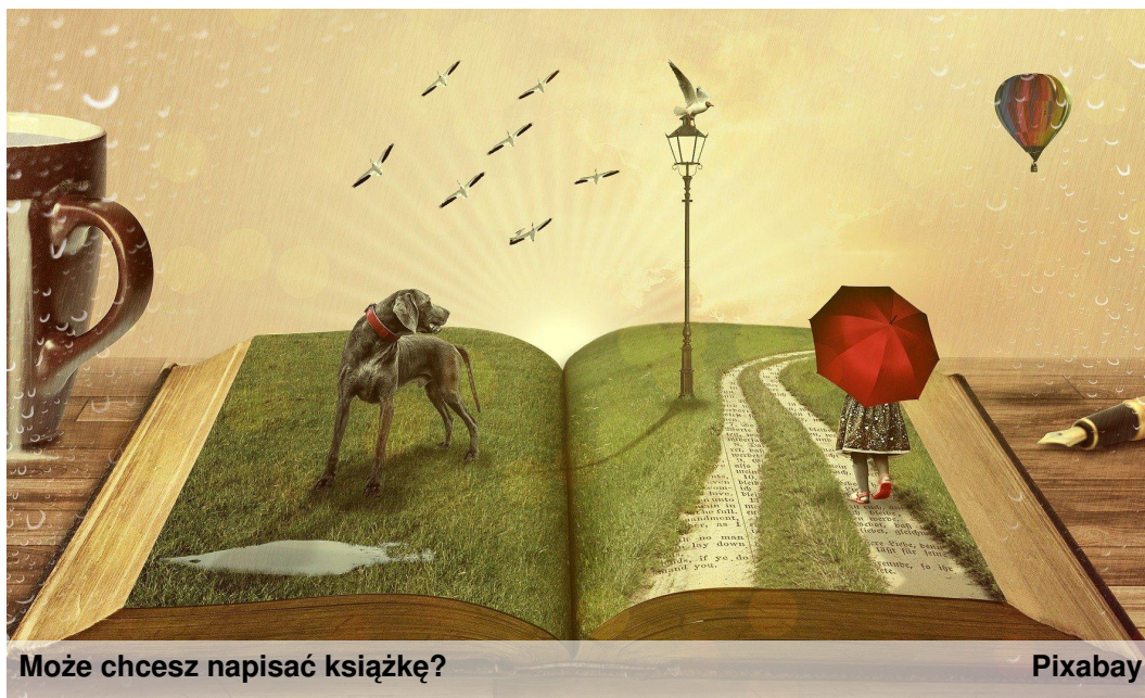
Może chcesz napisać książkę?