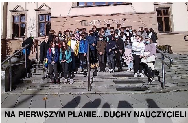
NA PIERWSZYM PLANIE... DUCHY NAUCZYCIELI

Dobę po Zaduszkach byliśmy na spektaklu o wywoływaniu duchów. Super przeżycie.