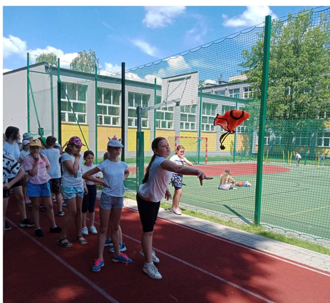
Dzień Sportu w SP 41