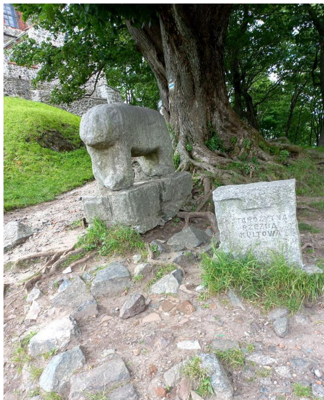
Rzeźba na Ślęży