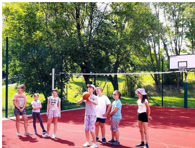
Dzień Sportu w SP 41