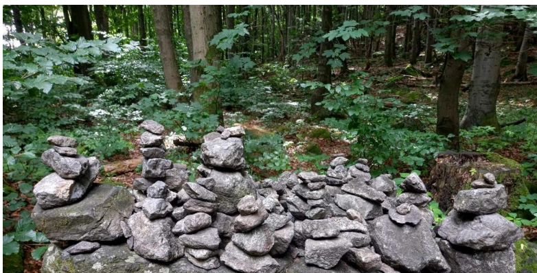
Na sudeckim szlaku