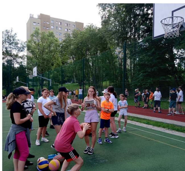
Dzień Sportu w SP 41