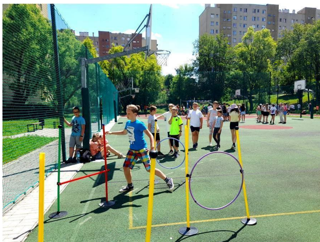
Dzień Sportu w SP 41