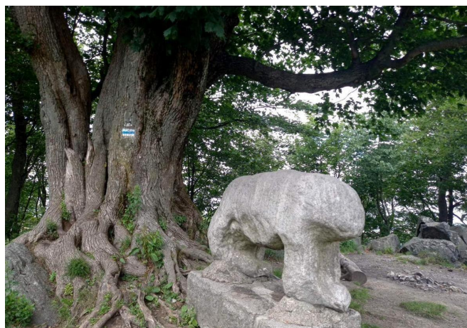
Rzeźba na Ślęży

Ślęża, najwyższe wzniesienie Masywu Ślęży (Przedgórze Sudeckie), na pierwszy rzut oka wydaje się małą górką, zaledwie 718 m n.p.m. Jednak wejście na nią wymaga sporo trudu (przekonałam się o tym kilka tygodni temu).