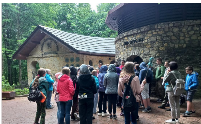
Klasy 6a, 7a i 7b