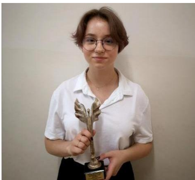
Absolwentka Roku 2021/2022