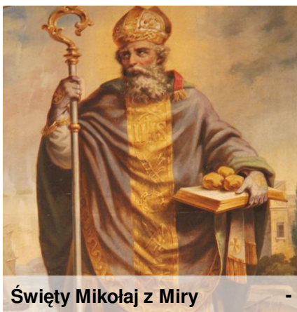
Święty Mikołaj z Miry

6 grudnia jest dniem uwielbianym przez dzieci. To dzień, w którym obchodzimy „Mikołajki”. Obdarowujemy się prezentami, upamiętniając św. Mikołaja z Miry. Mikołajkowy zwyczaj narodził się w XVIII wieku i trwa do dziś. W naszych czasach dzieci wierzą, że w Laponii żyje inny święty Mikołaj, który ze swoimi pomocnikami elfami ma fabrykę zabawek i to on w tym dniu rozdaje prezenty. Do domu wchodzi przez komin albo przez okno, a jego środkiem transportu są sanie zaprzężone w latające renifery. Św. Mikołaj jest bohaterem filmów, opowiadań i bajek m.in.: „Ekspress Polarny”, „Rudolf Czerwononosy Renifer” i wielu innych. Życzę Wam fajnych prezentów. Oczywiście nie zapomnijcie napisać listu do św. Mikołaja.