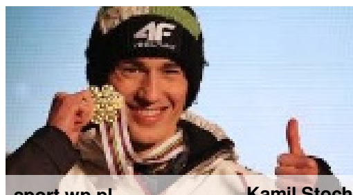
Kamil Stoch