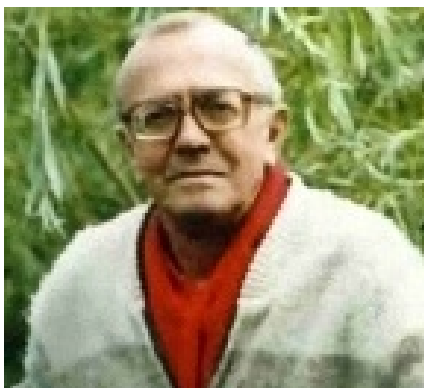
Zbigniew Nienacki

Seria powieści pt: "Pan Samochodzik" to jedna z najlepszych powieści przygodowych XX wieku. Autorem książek jest Zbigniew Nienacki a właściwie Zbigniew Nowicki. Opowiada ona o przygodach pana Tomasza detektywa, historyka sztuki. Pan Tomasz swoje przygodki zawdzięcza swojemu samochodowi odziedziczonemu po wujku-wynalazcy. Pierwsze tomy autorstwa Zbigniewa Nienackiego powstały ok. 1957 i są kontynuowane do dziś przez innych pisarzy. Ostatni tom książki powstał w grudniu 2013 roku i nosi tytuł "Ukryta biblioteka". Na podstawie książki powstał też film pt: Pan Samochodzik i Templariusze". Moim zdaniem książka jest ciekawa, wyjątkowa i oryginalna.