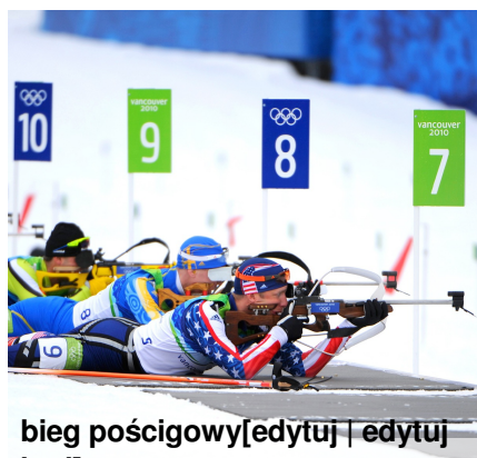
bieg pościgowy [edytuj | edytuj kod]

Thomas Diethart - austriacki skoczek narciarski który nie pochodzi z terenów górzystych Austrii ostatni zwycięsta turnieju CZTERCH SKOCZNI. W sezonie 2013/2014 został powołany Pucharu Świata