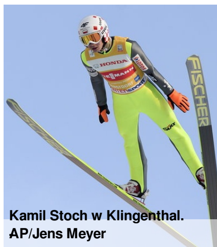
Kamil Stoch w Klingenthal.

Kamil Stoch - Polski skoczek narciarski, lider pucharu świata indywidualny mistrz świata drużyny brązowy medalista.