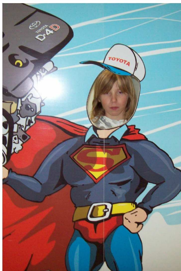
Kuba jako Superman

butelkach. Bardzo podobała się nam ta wycieczka, zwłaszcza, że niektóre przedstawione przez pracowników Toyoty metody