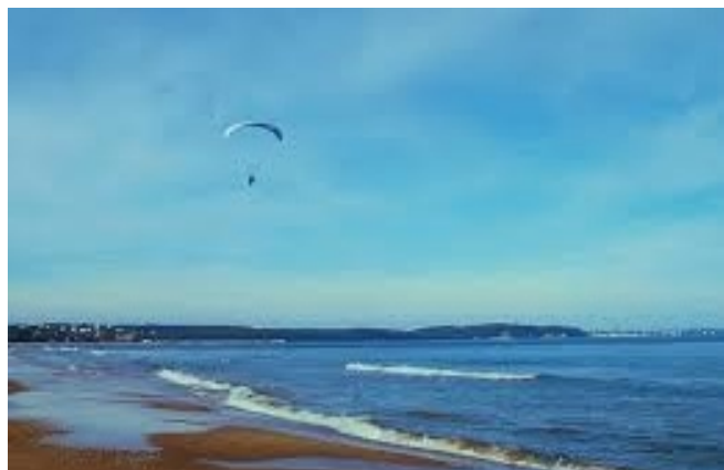
Kinga i ...