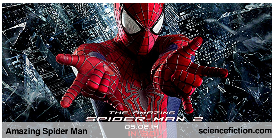
Amazing Spider Man

przyjaciela Harrego, który dowiaduje się od umierającego ojca, że on także umiera. Resztę dowiecie się sami podczas oglądania. POLECAM !)