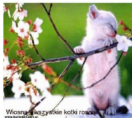
Wiosna - wszystkie kotki rosną. www.kotkieskocny.pl

Jeszcze z czasów pogańskich pochodzi święto wiosny o nazwie "Jare" - bogate w obrzędy powitania wiosny. Niektóre z tych obrzędów, np. topienie Marzanny znane