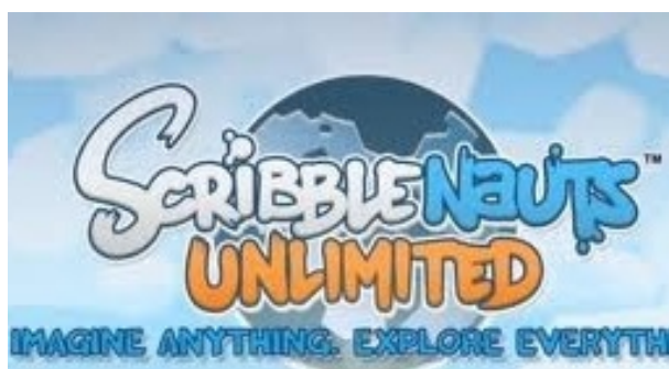
Sukcesów w grze!!!