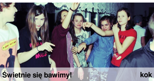
Świetnie się bawimy!