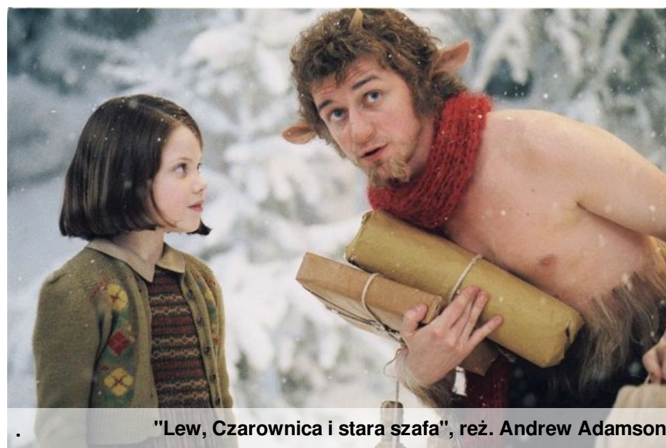
"Lew, Czarownica i stara szafa", reż. Andrew Adamson