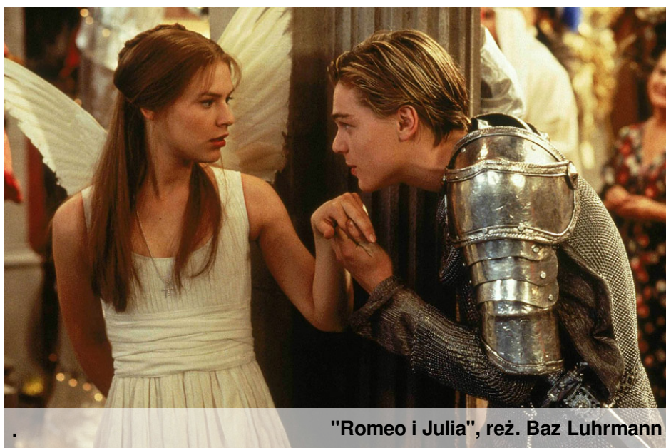
"Romeo i Julia", reż. Baz Luhrmann