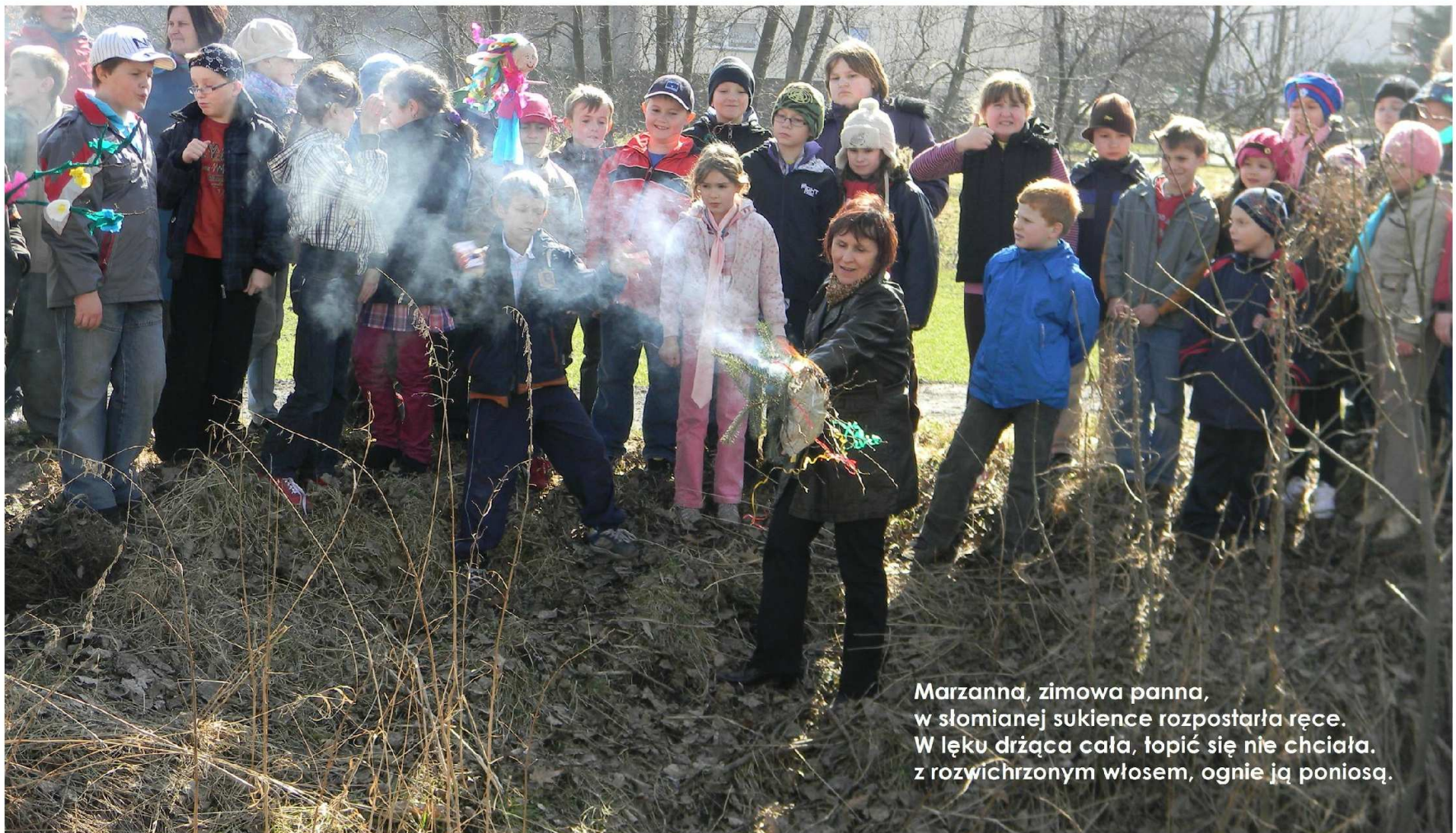
Marzanna, zimowa panna, w słomianej sukience rozpostarła ręce. W lęku drżąca cała, topić się nie chciała. z rozwichrzonym włosiem, ogień ją poniosą.

Naplotkowała sosna, że już się zbliża wiosna. Kret skrzywił się ponuro: - Przyjedzie pewno furą... Jeź się najeżył srodze: - Raczej na hulajnodze! Wąż syknął : - Ja nie wierzę! Przyjedzie na rowerze!