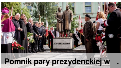
Pomnik pary prezydenckiej w