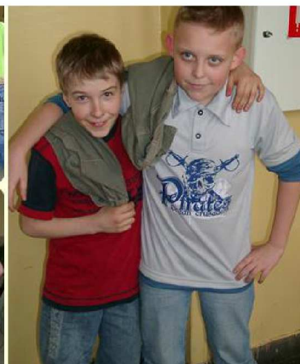
Na zdjęciach widzimy naszych modeli, którzy zgodzili się na zdjęcia.