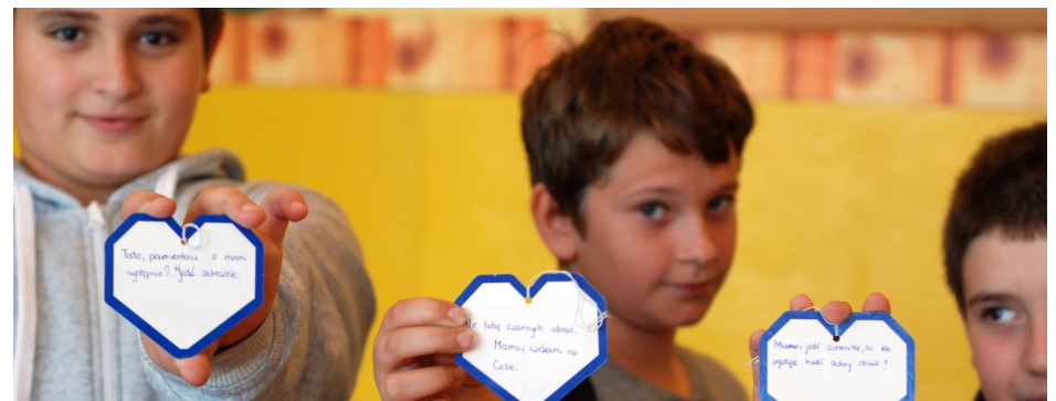
Tato, pamiętasz o moim występie? Kocham Cie! Jedź ostrożnie!