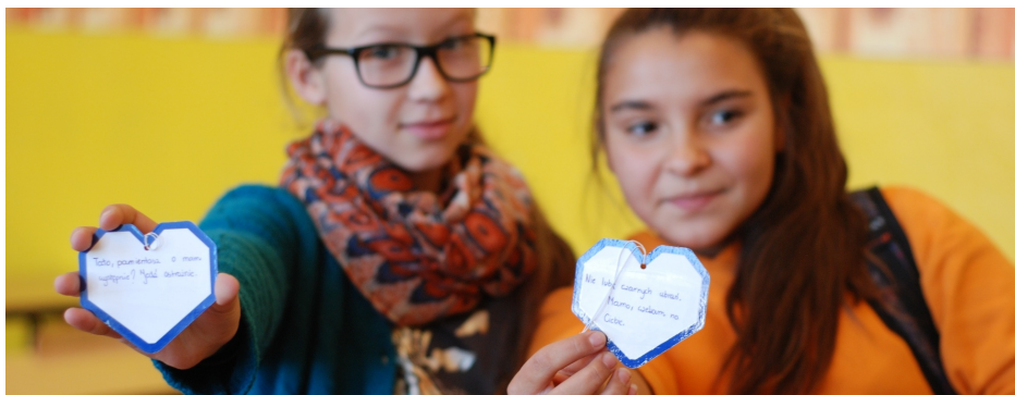
Nie lubię czarnych ubrań. Mamo, czekam na Ciebie!