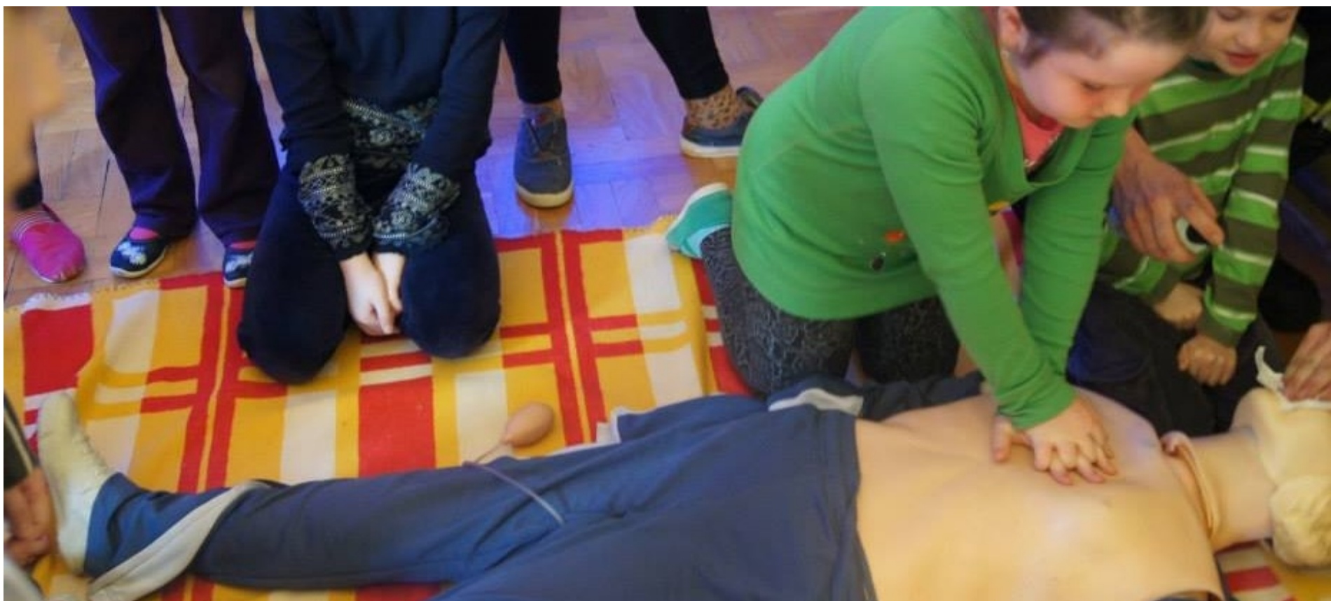
Uczymy się pomagać