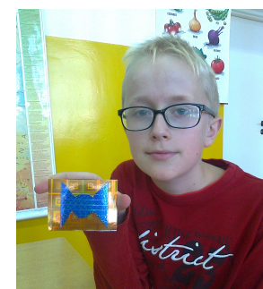
Myślmy o bezpieczeństwie A.Ł.