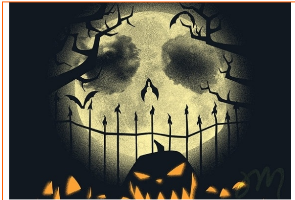
"Miasteczko Halloween" ("The Nightmare before Christmas") (1993), reż. Tim Burton

/opracowała: P. Wąchała, na podstawie: www.wikipedia.pl/halloween/