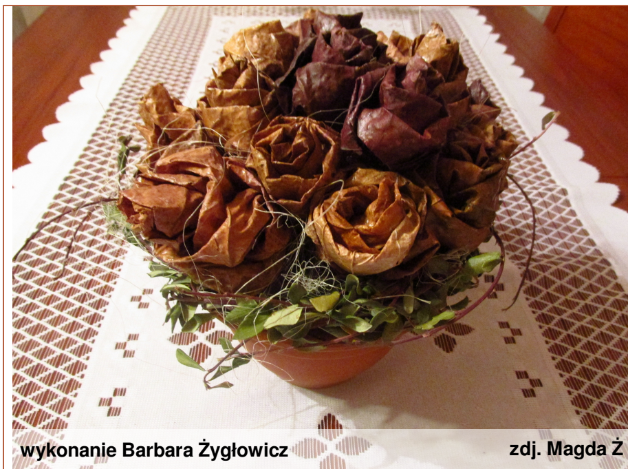
wykonanie Barbara Żygłowicz