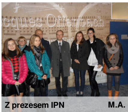
Z prezesem IPN

Zostaliśmy zaproszeni do Teatru Muzycznego w Poznaniu na podsumowanie akcji "Zapał znicz pamięci".