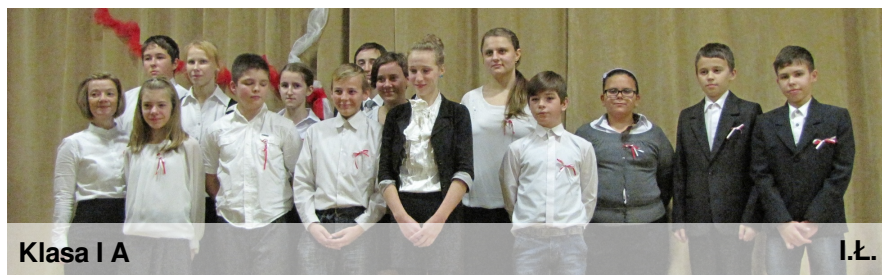
Klasa I A