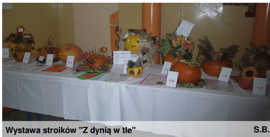
Wystawa stroików "Z dynią w tle"

I konkurs w ramach rywalizacji "Świętujemy z klasą" związany był z dynią. Każda klasa miała przygotować stroik, którego głównym elementem była dynia. Na wystawie znalazło się 12 prac. Komisja w składzie: p.E.Plota, p.N.Woźniak i p.S.Kupś- dyrektor wyłoniła zwycięzców: I m-ce - 2 C, II - 3 A, III - 3 D, IV- 3 B, V - 1 B i 1 C, VI - 2 A i 2D.