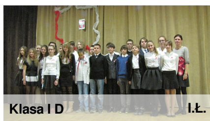
Klasa I D