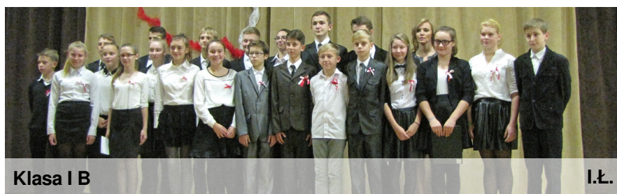
Klasa I B