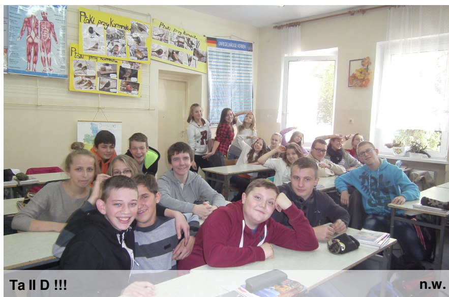
Ta II D !!!