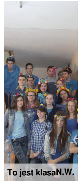
To jest klasaN.W.

Według "Słownika Języka Polskiego" klasa to: - jeden z oddziałów obejmujący roczny program nauczania, uczniowie jednego oddziału, jednego roku. U nas - klasa to oddziały składające się z od 17 do 31 uczniów (liczba zmienia się w zależności, ilu powtarza klasę).