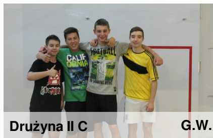
Drużyna II C