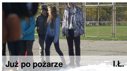
Już po pożarze