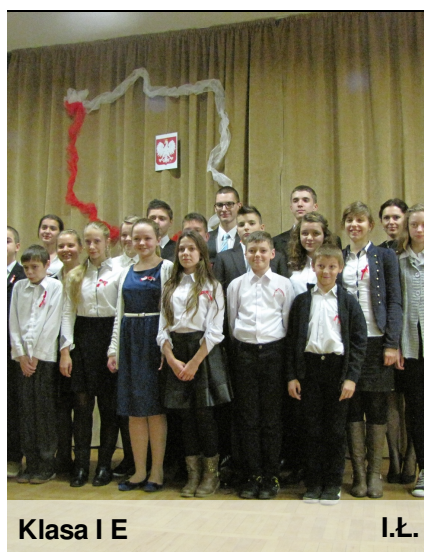
Klasa I E