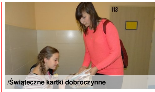
/Świąteczne kartki dobroczynne