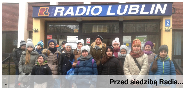
Przed siedzibą Radia...

Niezapominanych wrażeń dostarczyła nam wycieczka do Lublina. Centralnym punktem programu było zwiedzanie siedziby Radia Lublin. Mieliśmy możliwość obejrzenia pomieszczeń radiowych, służących dziennikarzom do przygotowywania c.d.str 3.