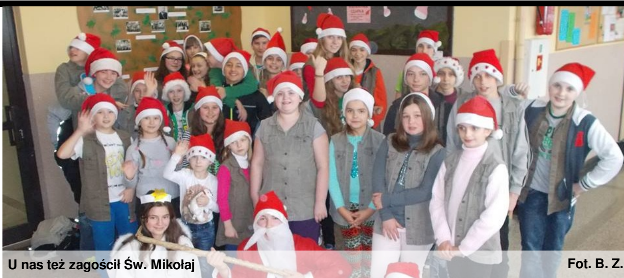
U nas też zagościł Św. Mikołaj