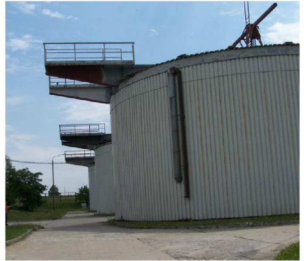
Oczyszczalnia ścieków w Krzyżowicach

organizowane są tak zwane patrole ekologiczne, których zadaniem jest przemierzenie całej gminy i pozбиieranie śmieci wyrzucanych na przykład z samochodów. Uprzątnięto