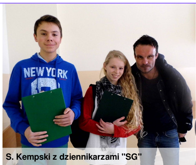
S. Kempski z dziennikarzami "SG"

SG: A dokąd zabrałby ich Pan w czasie tych licznych podróży?