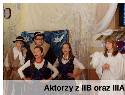
Aktorzy z IIB oraz IIIA