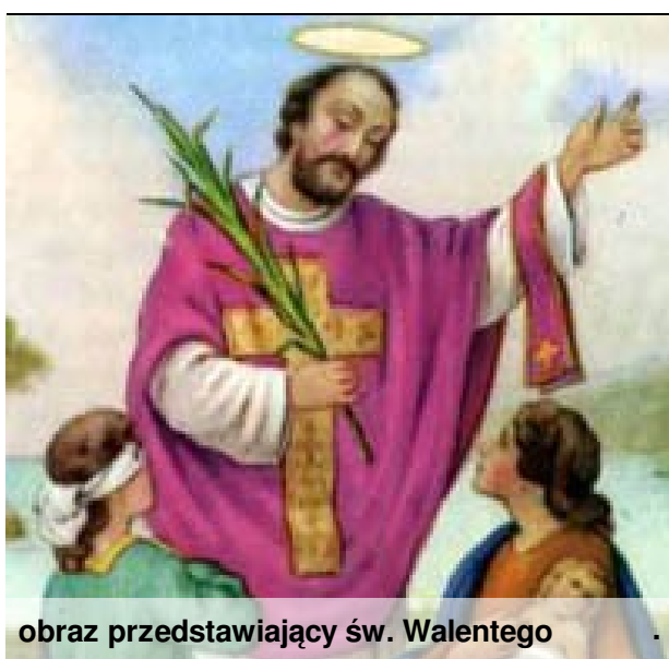
obraz przedstawiający św. Walentego