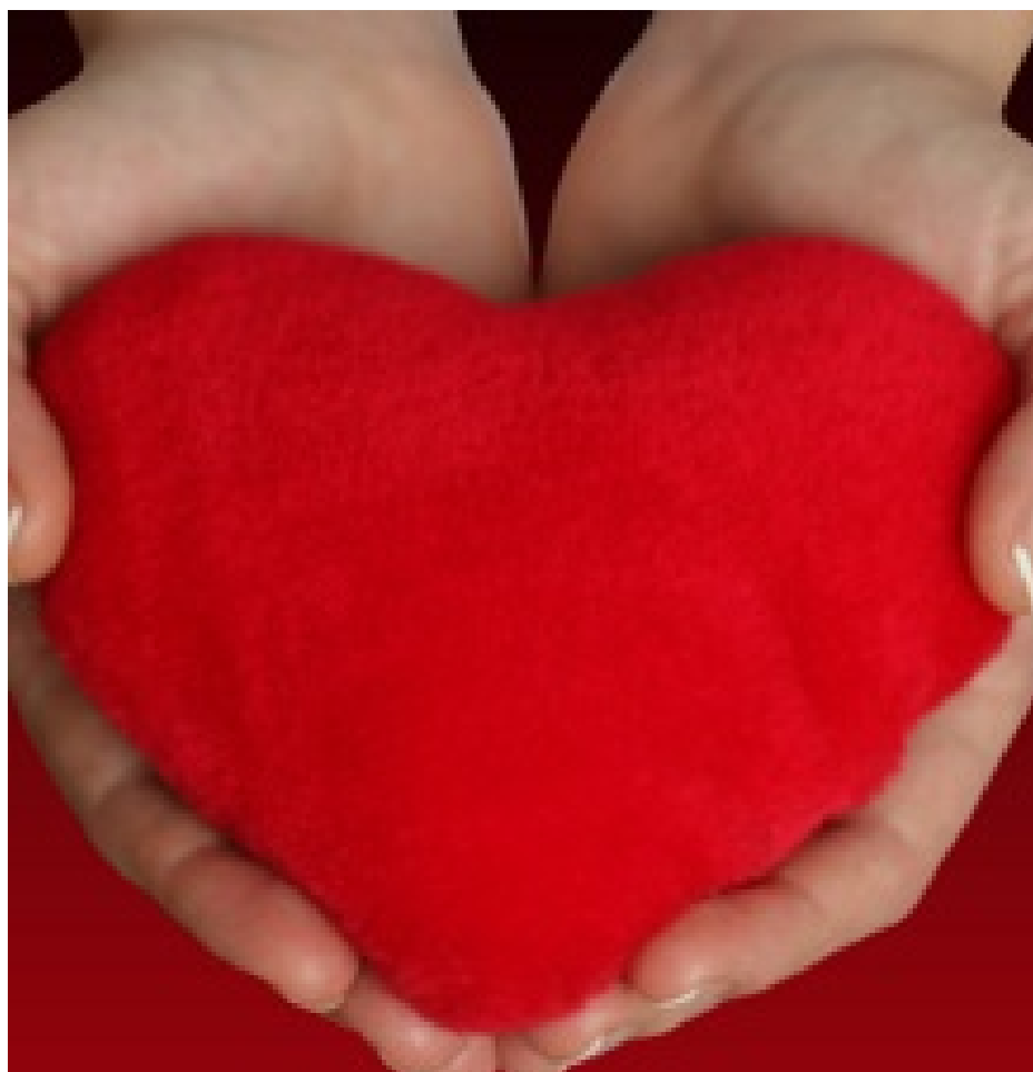
Miłości nigdy za wiele!

Najsłynniejszym walentynkowym upominkiem było jabłko pokryte różowym lukrem, ułożone w hebanowej szkatułce wysadzonej perłami i ofiarowane Annie Boleyn przez króla Henryka VIII.