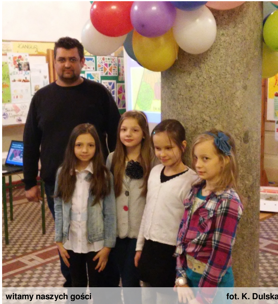
witamy naszych gości