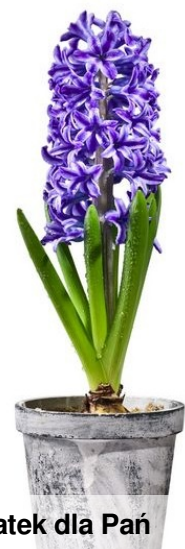
Kwiatek dla Pań